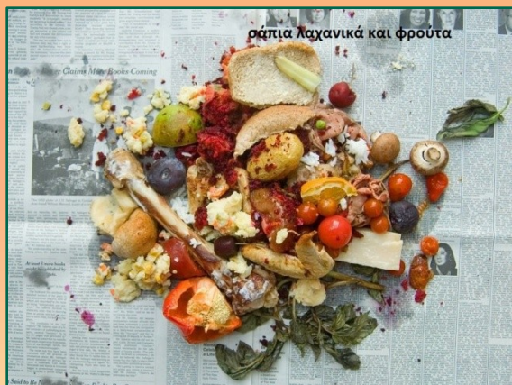
σάπια λαχανικά και φρούτα

Λυπάμαι. Έβαλες άρρωστα φυτά στο κομπόστ και το χάλασες. Πήγαινε πίσω 6 τετράγωνα